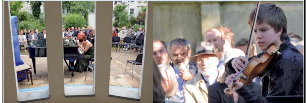
Regelmäßige Konzerte spiegeln die künstlerische Entwicklung der StipendiatInnen wider Periodic Concerts Display the Development of the Young Artists