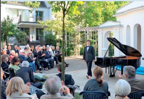
Serenadenkonzert im Garten der Vielharmonie Serenade in the Vielharmonie Garden

Die Gundlach Stiftung und die Firmengruppe Gundlach haben im Jahr 2004 den Gundlach Musikpreis für Studierende der Hochschule für Musik, Theater und Medien Hannover (HMTMH) gestiftet. Der Preis wird alle zwei Jahre an ausgewählte Studierende der Hochschule vergeben, die sich durch besonders hohe künstlerische Leistungen und soziales Engagement auszeichnen. Eine