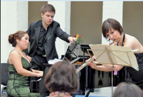
Stipendiatinnen beim gemeinsamen Musizieren Scholars Practicing Together

In 2004 the Gundlach Foundation and the Gundlach Group founded the Gundlach Award at the University of Music, Drama and Media Hanover (HMTMH) for students who have demonstrated extraordinary talent and a high level of social consciousness. Three students are selected every two years by an independent jury to receive this award. Each scholarship holder receives a monthly