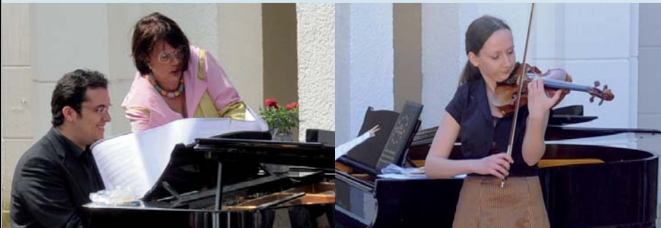
Igor Levit, Gundlach-Preisträger 2007 Award Winner

Schumann kannte den herausragenden Violinisten und Komponisten Joseph Joachim seit 1843, als dieser, vermittelt durch Mendelssohn, im Kindesalter zum Vizekonzertmeister des Gewandhausorchesters ernannt wurde.