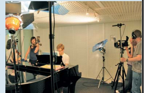
Filmaufnahmen in der Übebox Video-recording in the Practice Room

groups. The opulent, spacious garden with its quaint but romantic pavilion gives the house added appeal. Interestingly, the garden itself was an award-winner in the Hanover Garden and Courtyard Competition in 2005. Inspired by the international diversity of the music and the new residents, the founders appropriately christened the home Vielharmonie – an allusion to the many different