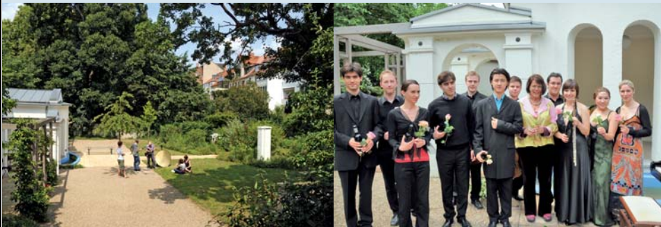
Der großzügige romantische Garten der Vielharmonie / The Romantic Garden

Förderkultur. Natürlich habe ich mich über die Ehrung sehr gefreut und bin zutiefst dankbar dafür, jedoch bietet die Förderung junger unterstützungswürdiger Musiker allein bereits Freude genug. Das Preisgeld wurde für die Produktion dieser CD aus der Vielharmonie verwendet.