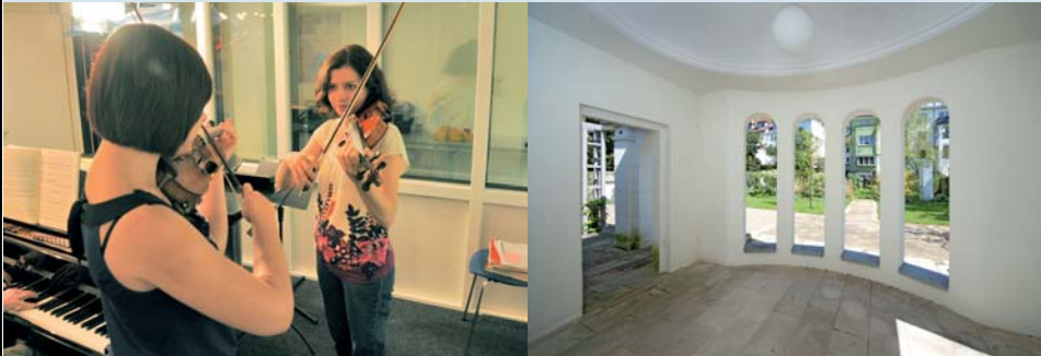
Proben in der Übebox Rehearsing in the Practice Room

The Praetorius Prize for 2009 was the motivating force underlying the production of this album. This prestigious award, which is sponsored by the Ministry of Science and Culture of Lower Saxony and which includes a sum of 5000 Euros, was given to me in recognition of my voluntary support of young musicians and music projects. Talented aspiring artists who have, in addition to their mu-